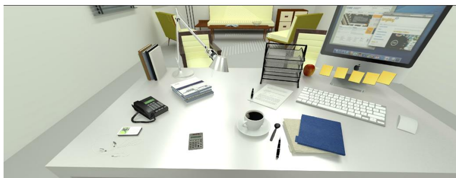
Figura 1. Despacho virtual

En la pantalla del ordenador se encuentran enganchadas pequeñas notas amarillas. Son mensajes que deja el titular de la asesoría fiscal o del departamento de la Administración tributaria, en los que se encarga algún trabajo o bien se da noticias del desarrollo de los asuntos en los que se está colaborando. Estas notas amarillas, que van acompañadas de una banderita roja de advertencia, se abren haciendo clic encima. Una vez leída, la nota desaparece, pero se almacena automáticamente en un repositorio (la página inicial del campus de la UOC que hay abierta dentro de la pantalla del ordenador). Clicando sobre esta pantalla del ordenador, se accede a la lista completa de todas las notas que hasta el momento ha hecho llegar el consultor.